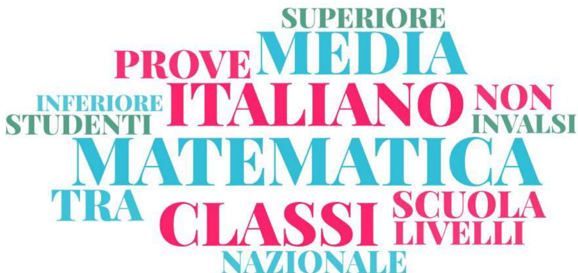
Figura 5.1 - Parole piene a frequenza elevata relative alle Motivazioni del giudizio dell'area Prove standardizzate nazionali

Tra le parole a frequenza media troviamo “varianza” (= 404), “discostano” (= 381), “background” (= 410), “socio” (= 395), “economico” (= 378), “culturale” (= 385), “punteggio” (= 365), “dati” (= 214), “dato” (= 101), “percentuale” (= 96), presumibilmente utilizzate dalle scuole per illustrare la propria situazione con riferimento ai risultati raggiunti. I termini “primaria” (= 263), “secondaria” (= 184),